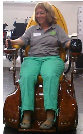
Verena probiert einen Spezialrolli aus

Ein Ausspruch von Dennis Klein auf dieser Messe: „Menschen sind nicht behindert, sondern werden durch gesellschaftliche Strukturen behindert gemacht.“