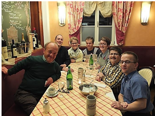
Nach unseren Messetagen