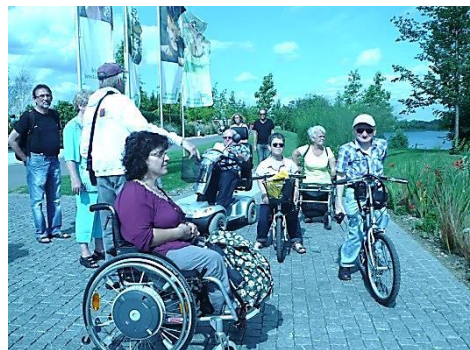
Landesgartenschau in Zülpich