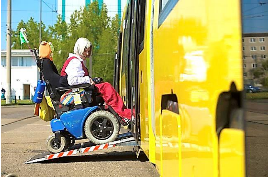
Das Straßenbahnnetz der BVG wird immer barrierefreier Dank der neuen Flexity-Bahnen

Das Straßenbahnnetz der BVG wird immer barrierefreier Dank der neuen Flexity-Bahnen.