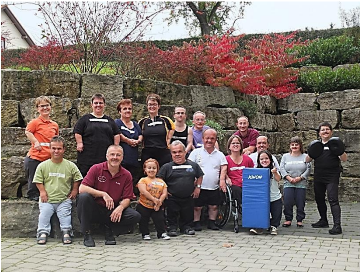
Gruppenfoto nach dem Selbstverteidigungskurs