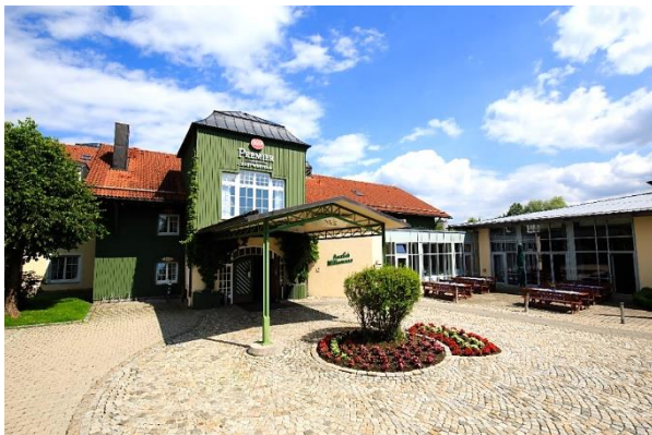
Best Western Premier Bayerischer Hof Miesbach ****

dieses Jahr findet das Herbsttreffen des Landesverbands Bayern in Miesbach statt. Dazu lade ich Euch herzlich ein.