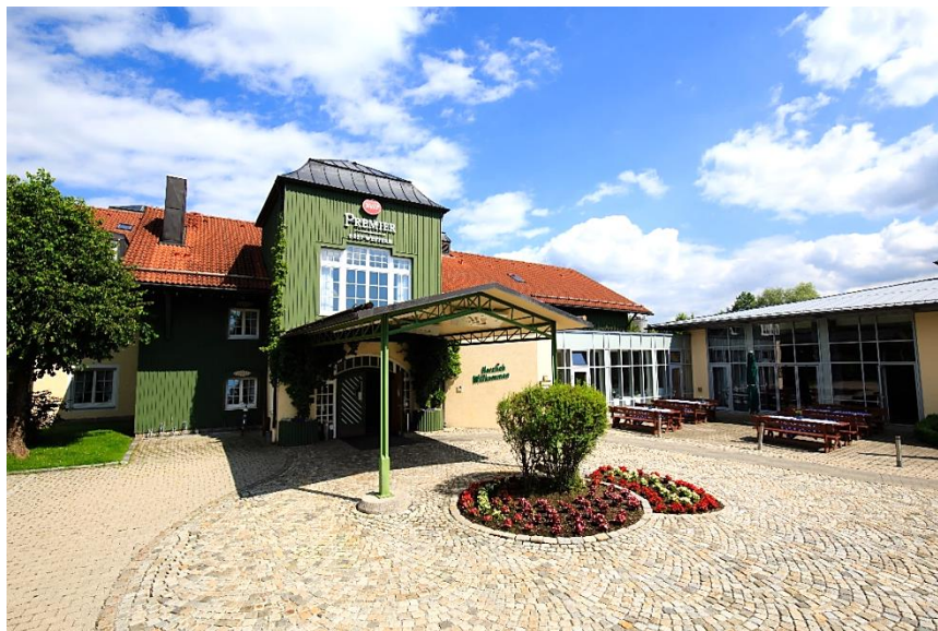
Best Western Premier Bayerischer Hof Miesbach ****

herzliche Einladung zum Adventstreffen des Landesverbandes Bayern, das dieses Jahr in Miesbach stattfindet.